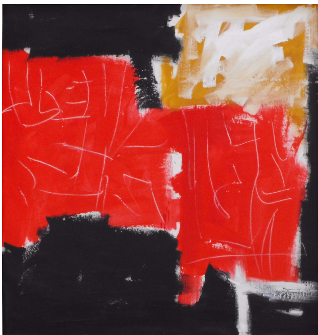
Inquisito 1993 acrilico su cm 150x155