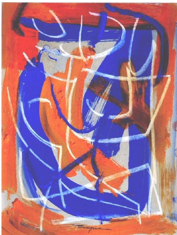
Informale 2000 acrilico su carta cm 30x40 - 003