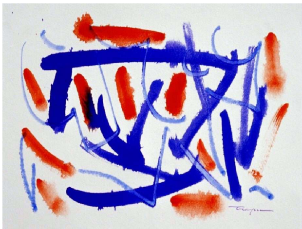
Informale 2005 acquarello su carta cm 54x74 - 001