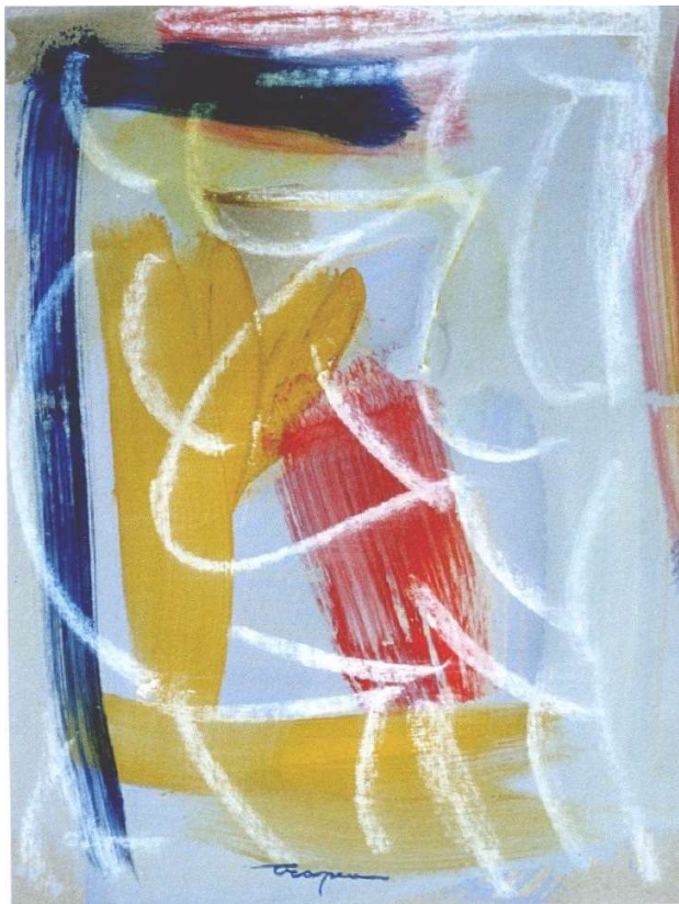
Informale 2000 acrilico su carta cm30x40 - 004