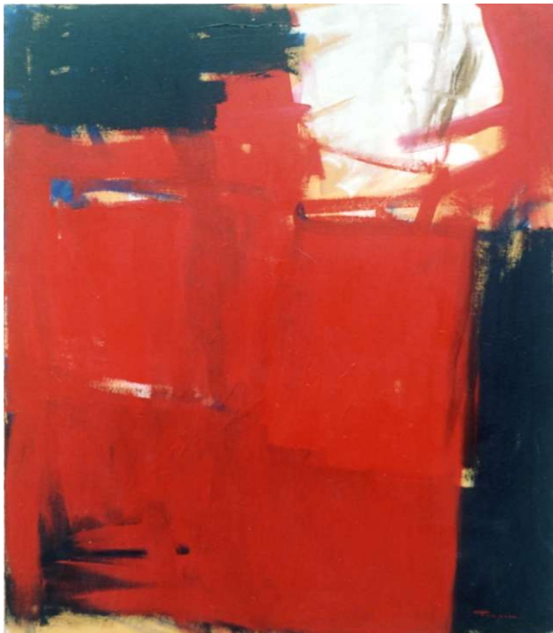
Informale 1988 acrilico su tela cm 70x90 - 7