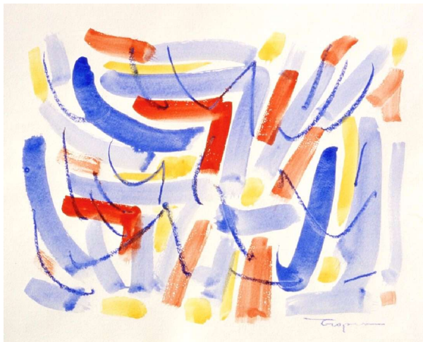
Informale 2004 acrilico su carta cm 40x50 - 004