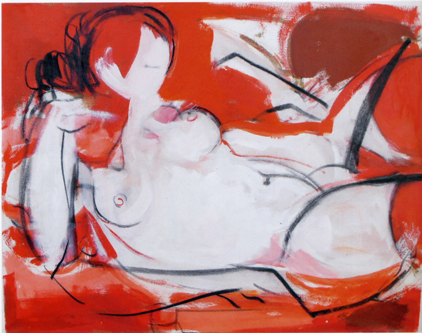
NUDO - acrilico su tela - cm. 70 x 90 - 2010