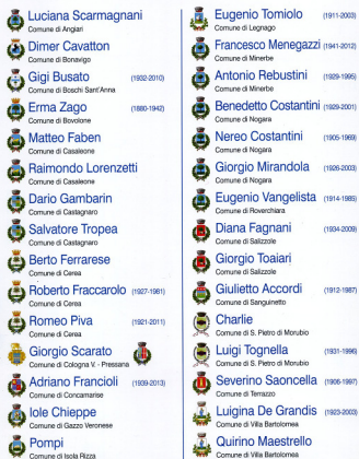
2013 2 Cat.La Bassa Veronese dell'Arte del Novecen.jpg