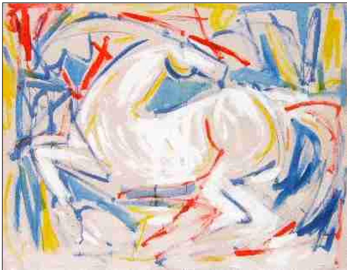
Cavalli - acrilico su tela cm 200x150 - 2008

una collezione di 80 opere del maestro dei vari periodi creativi