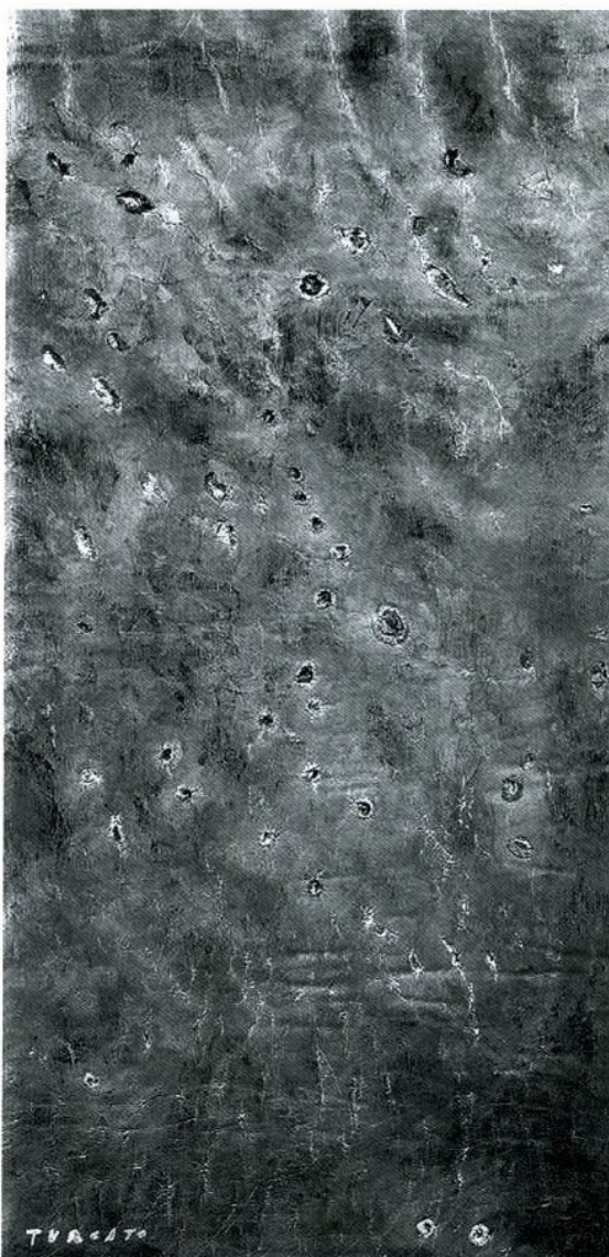
Turcato, Superficie lunare. (metà anni Settanta), olio e tecnica mista su gommapiuma applicata su tavola 60 x 120 cm, € 35.140/VP

Secessione Artistica e l'anno dopo entra nel Fronte Nuovo delle Arti. Dopo un periodo d'ispirazione neocubista, firma il manifesto Forma 1, avviando la sua ricerca in direzione astratta, debitrice in parte a Picasso, al Futurismo (specie all'opera di Balla) e a Magnelli. Compone i cicli dedicati alle "Rovine di Varsavia" e alle "Rovine di guerra", ispiratigli dalla partecipazione al Congresso della pace svoltosi a Varsavia (1948). Fino alla metà degli anni Cinquanta nei suoi lavori pone l'accento sull'impegno politico: nei cicli "Rivolte", "Comizi", "Fabbriche" e "Miniere" il colore è disposto in schematiche griglie geometriche che raffigurano elementi simbolici (per esempio le bandiere rosse). Suc-