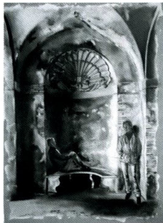
Tripodi, Anima Danzante, acrilico 60 x 80 cm, € 1.400/G

getti: figure. Tecniche: olio e tecnica mista su tela. Hanno scritto dell'artista: Consorti, Lepri, Turchetti.