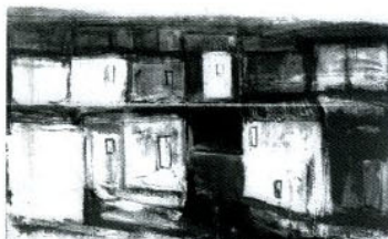
Tropea, Paesaggio, 2016, acrilico e materici 120 x 90 cm, € 7.000/G

Catania e appreso la fusione a cera persa all'Arturo Bruni di Roma. È stato creatore ceramico alla Eduard Bay di Ransbach Westerwald (Germania) e ha studiato incisione calcografica col maestro Eugenio Tomiolo. Partecipa attivamente alla vita artistica nazionale e internazionale e ha al suo attivo numerosissime mostre personali e collettive nelle più importanti città italiane ed europee. È stato recensito da importanti critici e storici dell'arte su quotidiani, riviste e prestigiosi cataloghi. Le sue opere figurano in collezioni pubbliche e private in Italia e all'estero. Soggetti: figure, cavalli, composizioni informali. Tecniche: olio, acrilico, miste; scultura in bronzo.