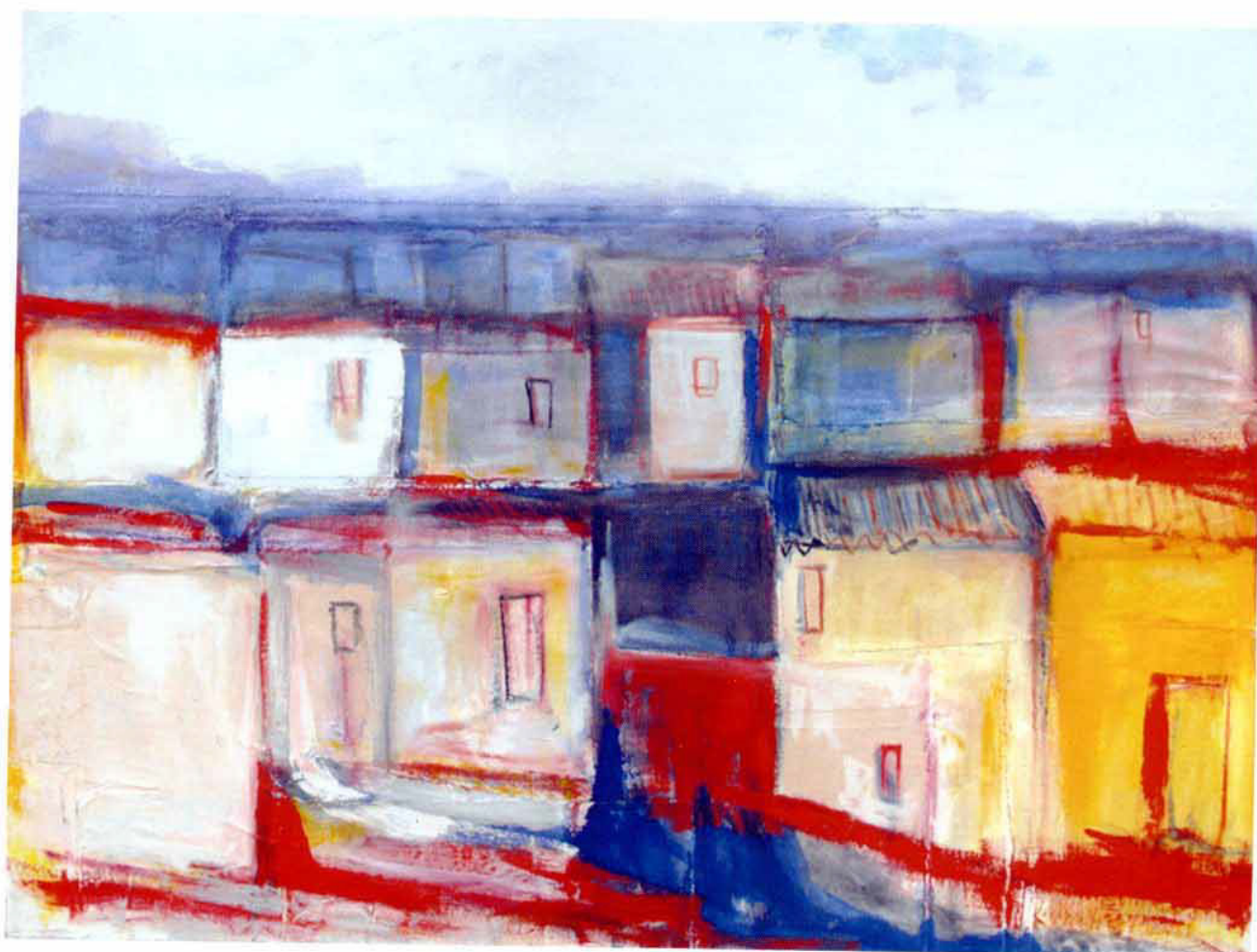
Paesaggio / acrilico su tela / cm. 90 x 120 / 2016

Indirizzo: 37010 Affi - Verona (Italy) - Via della Repubblica, 58 Tel. + 39 045 6261202 - Cell. + 39 339 8591346 - + 39 338 9994309 - tropeasalvatore@alice.it - www.tropeasalvatore.it